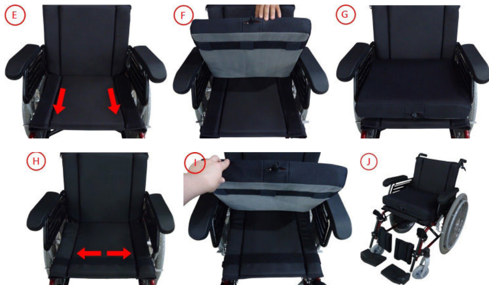
Figura 3: Colocação da almofada na base.

A Figura 3 ilustra a colocação da almofada em dois tipos de base. Os itens E, F e G demonstram a colocação da almofada em uma base com o velcro posicionado verticalmente. Já os itens H, I e J mostram a almofada sendo colocada em um assento com velcro de posicionamento horizontal.