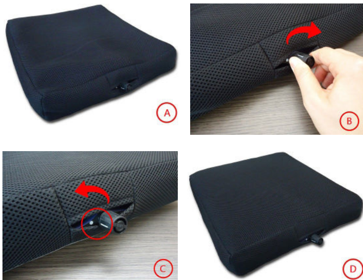
Figura 1: Instruções de uso.